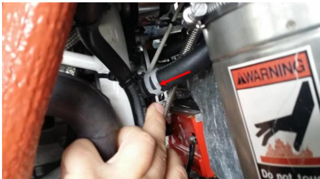
Рис.2 Зажим конца шланга у двигателя