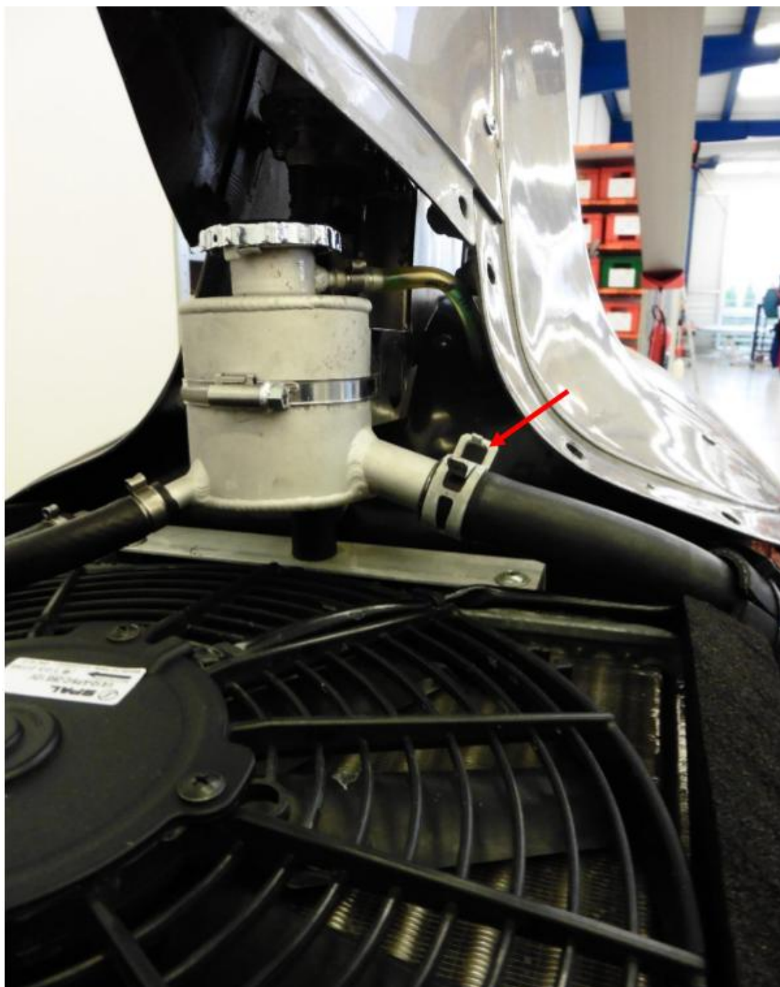
Рис.3 Зажим шланга у расширительного бачка

Для информации и контактов: sales@auto-gyro.ru www.auto-gyro.ru