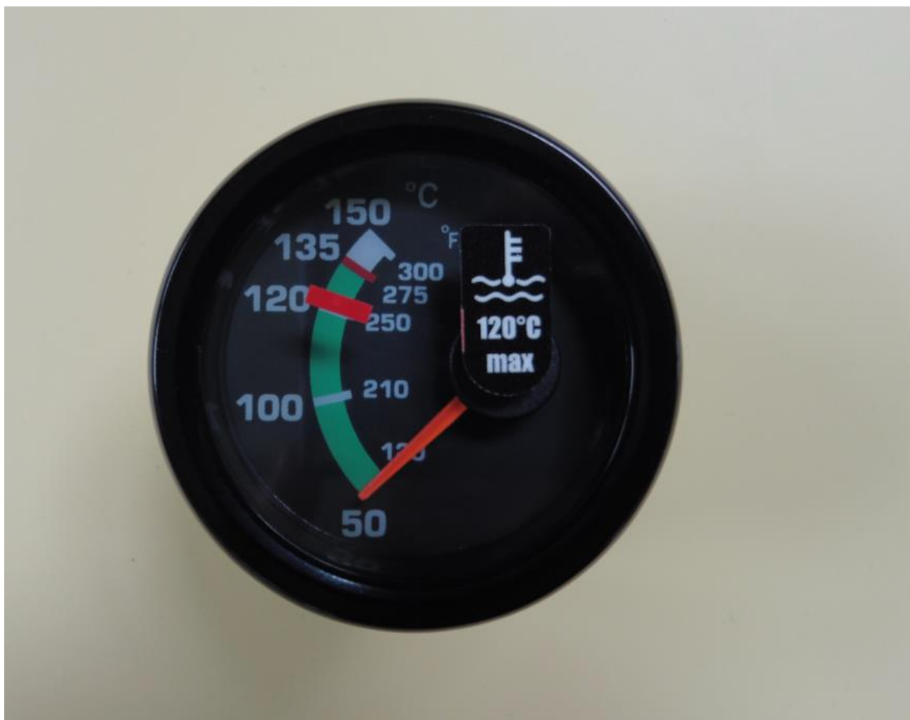
Рис. 3. Модификация прибора температуры головок цилиндров.

Для информации и контактов: sales@auto-gyro.ru www.auto-gyro.ru